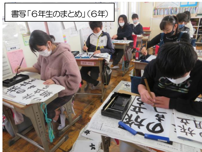
書写「6年生のまとめ」(6年)