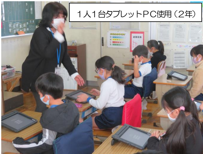
1人1台タブレットPC使用(2年)