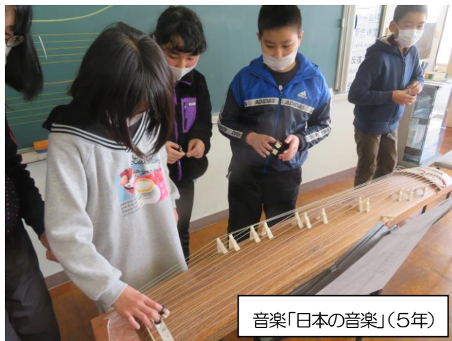
音楽「日本の音楽」(5年)