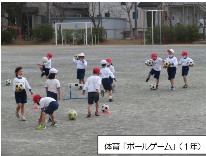
体育「ボールゲーム」(1年)