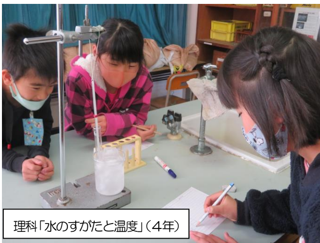
理科「水のすがたと温度」(4年)